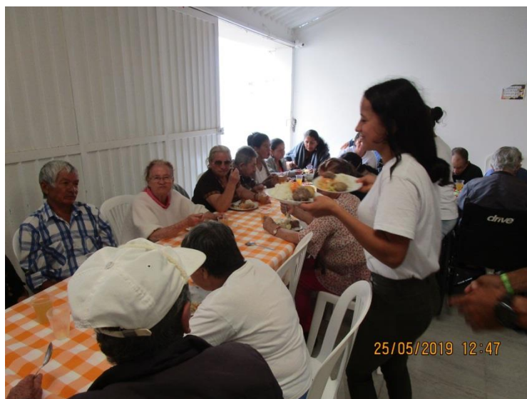
Comida durante la acción las 72 horas

A finales de marzo celebramos el aniversario de la Fundación. Fue una noche colorida con bailes, cantos y presentaciones de las diferentes áreas de la Fundación. Por eso ensayamos bailes con los niños y también con el equipo de la Casa Hogar. La celebración duró casi 5 horas.